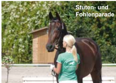
Stuten- und Fohlenparade