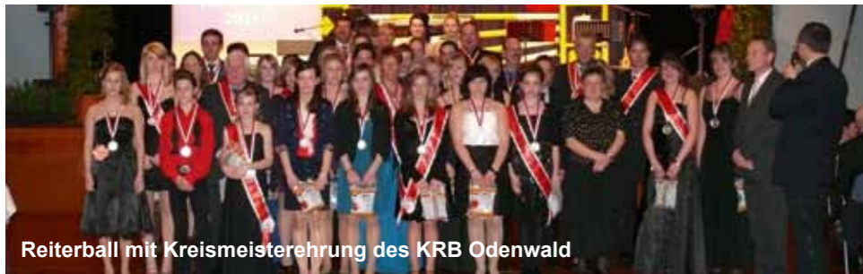
Reiterball mit Kreismeistertrophäe des KRB Odenwald