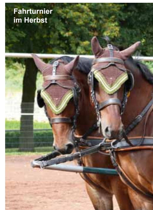
Fahrtturnier im Herbst

Der Springplatz wurde mit einem neuen Belag ausgestattet und die Abreitplätze haben eine neue Umzäunung erhalten. Eine im Jahr 2000 neu errichtete Longierhalle ermöglicht den Mitgliedern ein besseres gymnastizieren und trainieren ihrer Pferde. 2010 wurde im Zuge der Dachsanierung eine Solaranlage montiert und in eine Bewässerungsanlage für die Reithalle installiert. Mit diesen Maßnahmen wurden die Voraussetzungen für guten Reitsport nochmals verbessert.