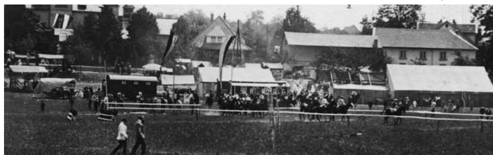
Sammelplatz für die Teilnehmer in den ersten Rennjahren auf der oberen Seewiese - Bild hinten links: Alte Kaserne, rechts: Erbacher Lichtspiele