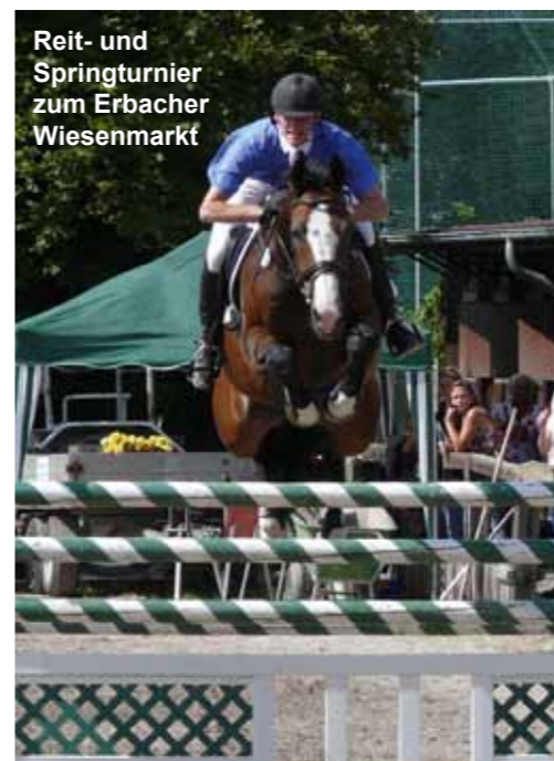
Reit- und Springturnier zum Erbacher Wiesenmarkt

Bis 2008 kamen auch die Züchter und Zuchtliebhaber mit der Süddeutschen Stuten- und Fohlenparade auf ihre Kosten, die alljährlich von der ZdfP auf dem Vereinsgelände veranstaltet wurde. Bis zum Jahr 2002 war der Verein auch Ausrichter der bekannten Hubertus-Schleppjagd , die traditionell im Erbacher Schlosshof begann und mit Naturhindernissen quer durch Wald, Feld und Wiesen der näheren Umgebung ging.