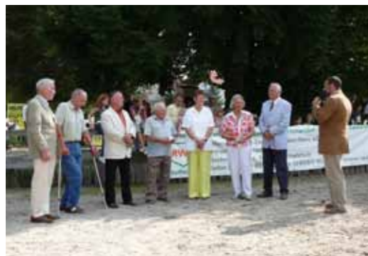
2007 - Ehrung der Gründungsmitglieder zum 50-jährigen Jubiläum

100 Jahre Odenwälder Reitverein e.V. 1911 - 2011